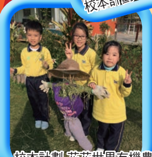
校本計劃-花花世界有機農莊