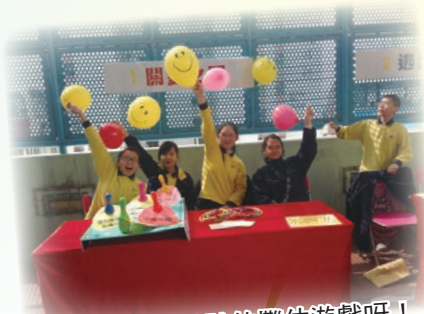
這是我們一起設計的攤位遊戲呀！