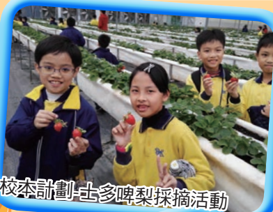
校本計劃-古多啤梨採摘活動