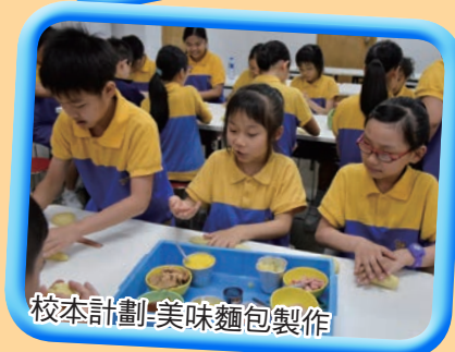
校本計劃-美味麵包製作