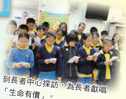
到長者中心探訪，為長者獻唱「生命有價」。

「關愛小天使」義工培訓計劃主要招募小五及小六學生為關愛小天使，進行義工培訓活動，讓他們學習做義工應有的態度及多關心身邊有需要的人。在此計劃下，校方同時為其他學生提供不同社會服務經驗，以鼓勵全校性關愛文化。活動包括「義工培訓工作坊」、「義工培訓營」、「社區攤位教育日」及「關愛探訪日」，參與學生均表示能夠幫助社區及長者，感到快樂及有意義。