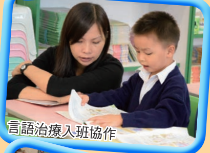
言語治療入班協作