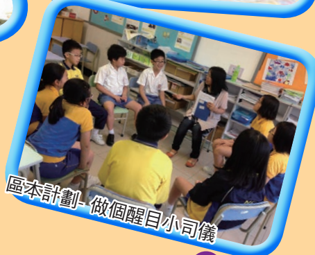
區本計劃-做個醒目小司儀